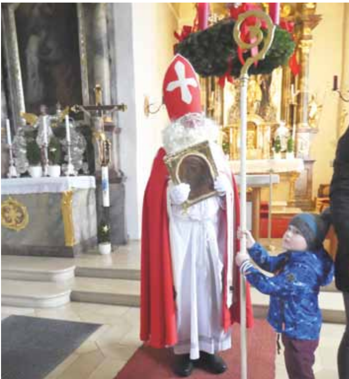
Die Kindergartenkinder empfangen den Hl. Nikolaus in der Kindinger Kirche.

Die Kindergartenkinder erwarteten etwas später den Bischof in der Kindinger Kirche. Sie riefen: „Nikolaus, Nikolaus!“ Tatsächlich, da konnte man ihn schon von Weitem mit seiner Glocke hören. Das Klingeln wurde immer lauter und die Kinder sahen nun am Kirchenfenster eine Mitra und einen goldenen Stab vorbeiwandern. Nachdem Nikolaus an die schwere Kirchentüre klopfte, wurde es in der Kirche mucksmäuschenstill. Langsam schritt er durch den langen Kirchengang und wurde dabei stets von den Kindern bestaunt. Am Altar angekommen, bat er ein Kind darum seinen Stab zu halten. Der Nikolaus zündete gemeinsam mit den Kindern den Adventskranz an und las aus seinem goldenen Buch vor. Am Ende der Feier musste der Heilige Mann weiterziehen. So dürfen sich die Kinder schon jetzt auf seinen Besuch im nächsten Jahr freuen.