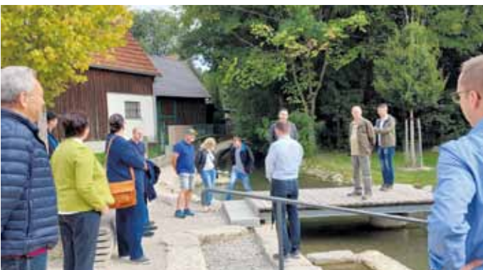
Wie in Enkering spielt auch in Ellgau das Einbeziehen von Wasser eine große Rolle bei der Gestaltung des Ortes

2023 will der Vorstand die Entwurfsplanung fertigstellen und die Plangenehmigung der geplanten Maßnahmen erreichen.