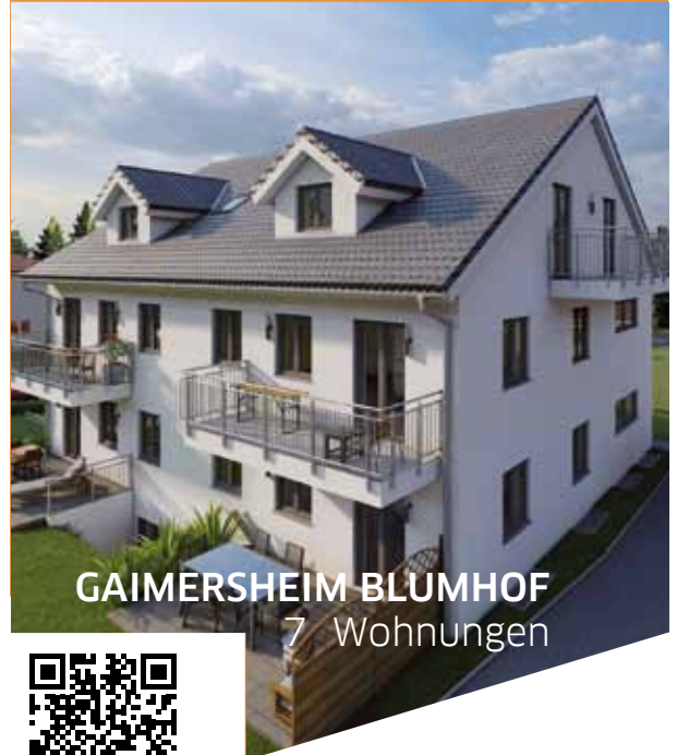
GAIMERSHEIM BLUMHOF 7 Wohnungen