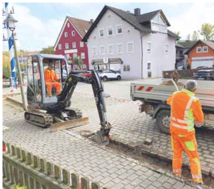
Der Bauhof legte die Bankette am Kindinger Marktplatz an

Pflaster dient der Sicherheit und Sauberkeit in dem Bereich. Der Bauhof ersetzte auch das Pflaster des Gehweges in der Haunstetter Dorfmitte.