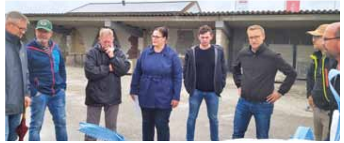
Genau hingeschaut und viel diskutiert wurde bei dem Besuch von Pflasterherstellern in Neumarkt

Herzlicher Dank gilt den ehrenamtlichen Vorständen und deren Stellvertretern für die konstruktive Zusammenarbeit übers Jahr. Ein besonderer Dank richtet sich auch die Gemeinde Kinding, für ihre Unterstützung des Verfahrens, sowie an Personen bzw. Vereine, die uns für Versammlungen und Sitzungen Örtlichkeiten zur Verfügung gestellt haben.