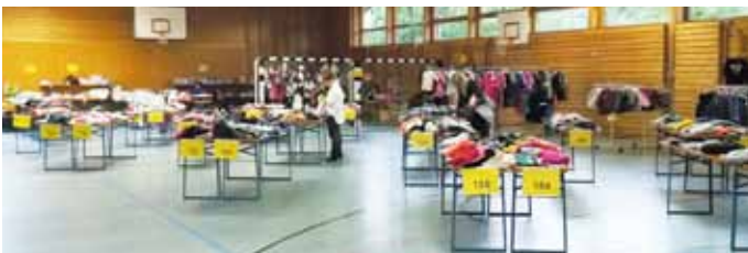
Wie hier im September, gibt es auch im kommenden Frühjahr wieder tolle Schnäppchen in der Kindinger Turnhalle.

Damit es auch im neuen Jahr wieder viele strahlende Gesichter gibt, sind die Termine für 2023 schon beschlossen. Am 11. März und am 22. September als Premiere am Abend hoffen in der Kindinger Turnhalle wieder viele Kleidungsstücke und Spielsachen auf ihre zweite Chance. Der Verkauf wird über das bewährte Easybasar System organisiert und das Basar Team ist über jede Unterstützung dankbar. Zukünftig wird außerdem die Artikelanzahl für die Helfer verdoppelt. Statt 60 können engagierte Eltern 120 Artikel zum Verkauf abgeben. Und auch das Einkaufen läuft für die Helfer entspannt, sie dürfen bereits am Vortag in aller Ruhe stöbern. Alle nötigen Infos finden Interessierte jederzeit auf der Homepage www.kinderbasar-kinding.de . (Text: Franziska Werner)