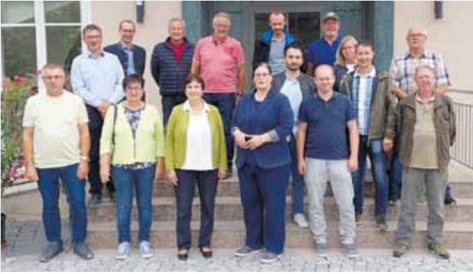
Enkeringer und Ellgauer Dorferneuerer

Das erarbeitete Konzept wurden im März der Öffentlichkeit in einer Versammlung vorgestellt und als Infobrief an die Haushalte verteilt (siehe Homepage Gemeinde Kinding).