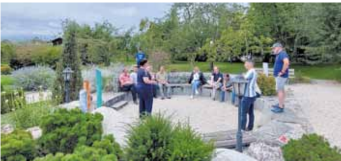
Auch Grünanlagen wie der Vereinsgarten in Thierhaupten standen auf dem Ausflugsprogramm

Im Herbst lud der Vorstand zu zwei Ausflügen ein: Der erste Ausflug führte nach Ellgau und Thierhaupten. Ellgau führt schon seit 2009 eine Dorferneuerung durch. Bürgermeister, Vorstände und Mitglieder von Arbeitskreisen begrüßten die Enkeringer Besucher herzlich und stellten ihr Verfahren vor. Die Ellgauer berichteten an verschiedenen Beispielen von ihren Erfahrungen und Ergebnissen.