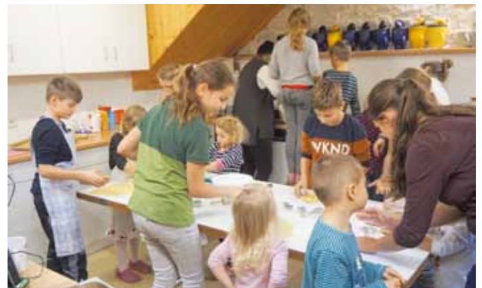
In der Weihnachtsbäckerei gibt es manche Leckerei ...