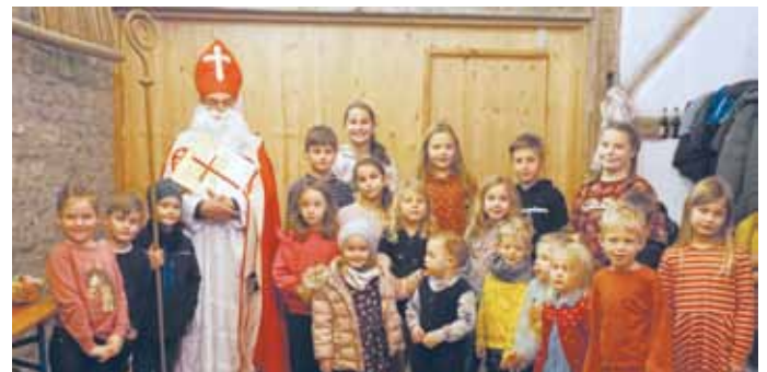
Der Nikolaus brachte den Kindern in Erlingshofen Säckchen mit Leckereien.