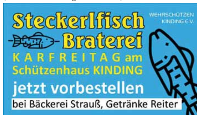
Ankündigung – Steckerlfischverkauf der Wehrschützen Kinding