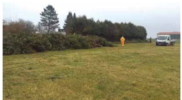
Mitarbeiter des Bauhofes entfernten die Thujen-Hecke am Friedhof Haunstetten.