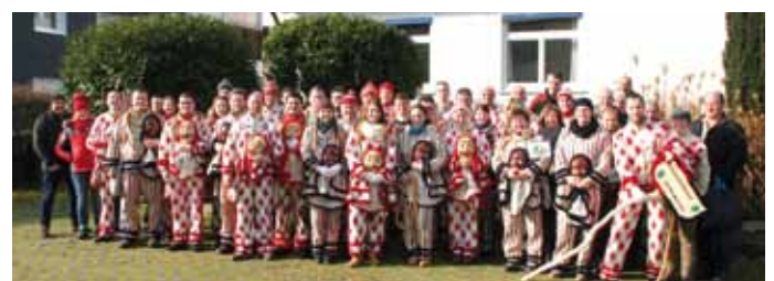
Gut 50 Haunstetter Schewerer nahmen am Landesnarrentreffen in Murrhardt, Baden-Württemberg teil.