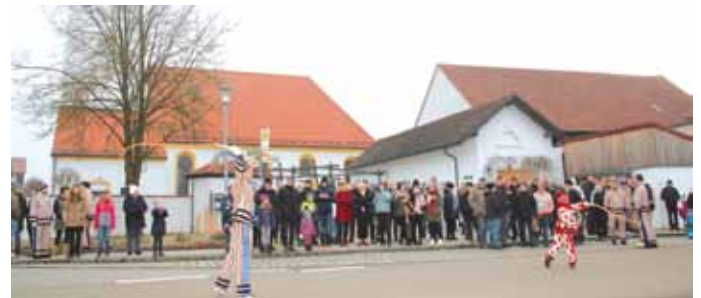
Die Goaßln der Großen und Kleinen Schewerer schnalzen wieder in Haunstetten. Viele Erwachsene und Kinder waren trotz Kälte zum „Anschnalzen“ in die Ortsmitte gekommen.