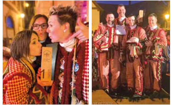
Die Kindinger Fosanegl beim Narrentreffen in Pfullendorf am Bodensee zusammen mit ihren Weltmeisterinnen und Drittplatzierten

geht der Blick der Fosanegl bereits auf die nächste Schnalz-WM. (Text und Bilder: Georg Brandstetter)