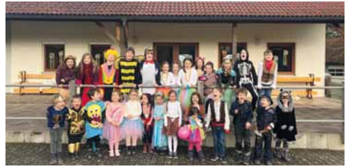
Mit einem gemeinsamen Pizzaessen endete der gelungene Familienfasching am frühen Abend. (Text: Carola Sedlmeier)