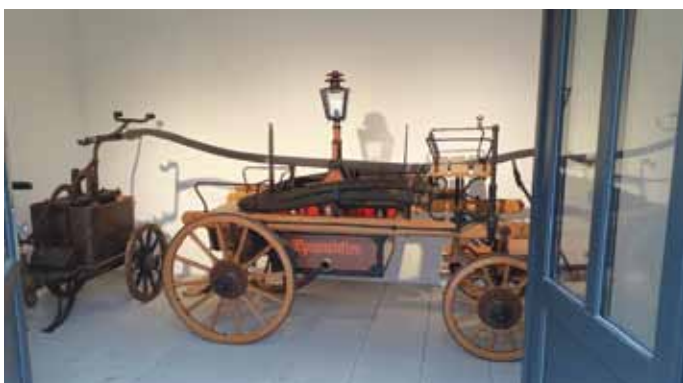
Beleuchtete Feuerwehrspritze im Waaghäusl