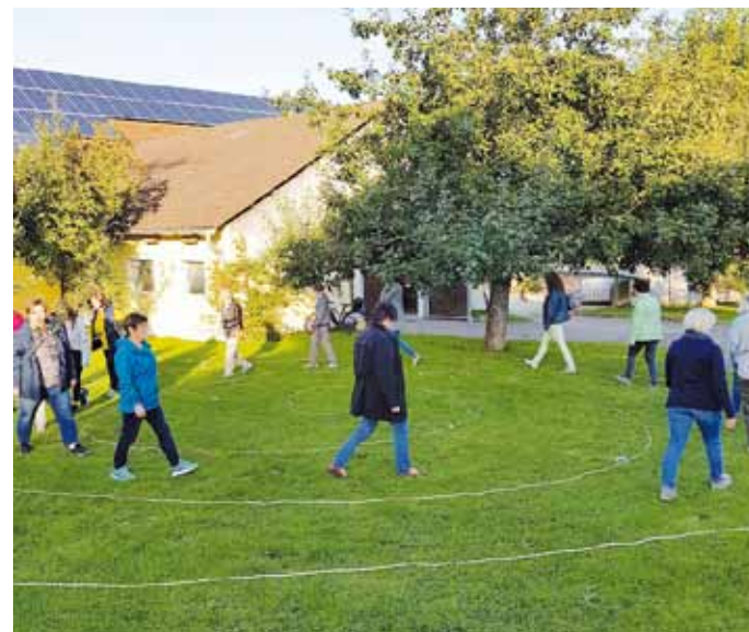
Die Frauen des Frauenbundes Kirchanhausen beim Gang durch die Spirale.

Anschließend traf man sich zum gemütlichen Beisammensein im Stadel der Familie Gebhard.