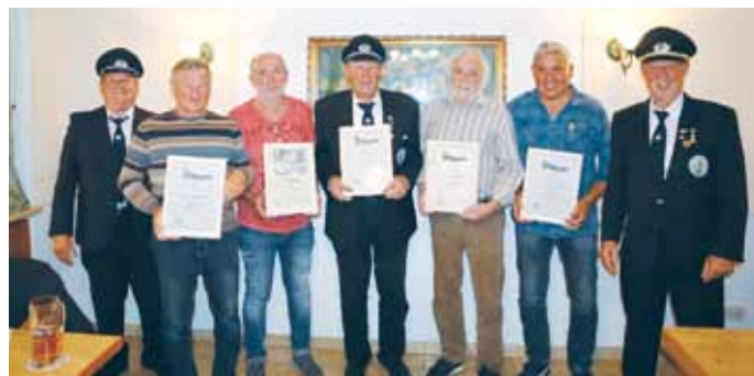
Ehrung der langjährigen Mitglieder bei der Jahreshauptversammlung des Krieger- und Soldatenvereines