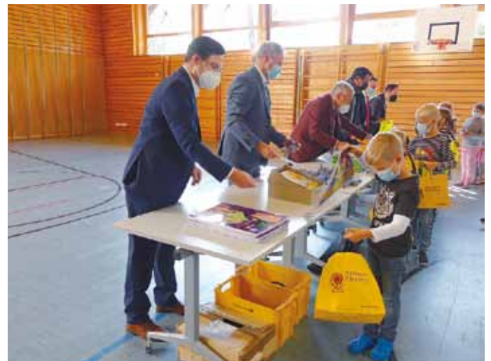
Präsentübergabe am Ende der Veranstaltung durch die geladenen Gäste.