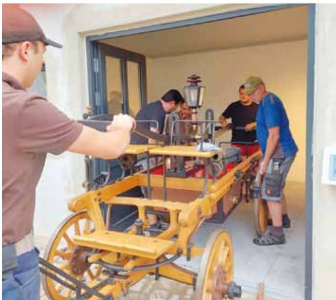
Einzug der Feuerwehrspritze in das Waaghäusl