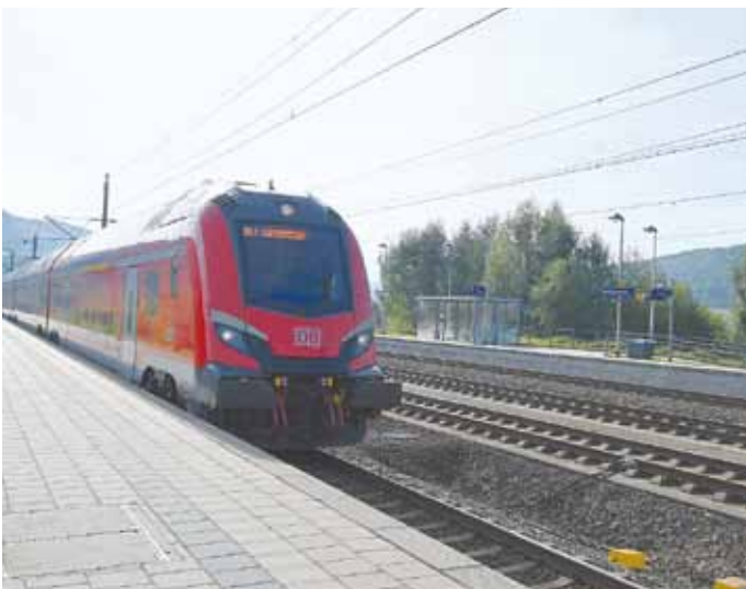
Die neue Fahrzeuggarnitur des München-Nürnberg-Express am Bahn- hof Kinding.

Trotz Protesten aus dem Landkreis Eichstätt und dem Landkreis Roth und breiten politischen Vorstößen konnte bisher keine Verbesserung erreicht werden.