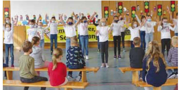
In den Redepausen legten die Drittklässler fetzige Tänze aufs Parkett.