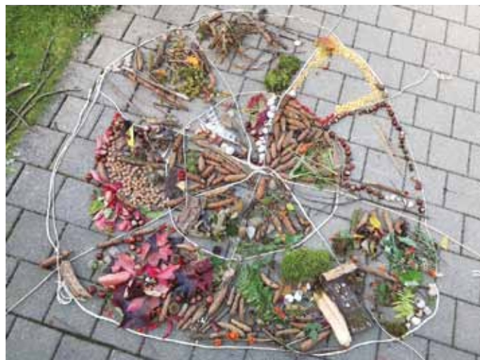
Dieses wunderschöne Naturmandala haben die Kindergartenkinder beim wöchentlichen Angebot „Der Natur auf der Spur“ selbst zusammengestellt.