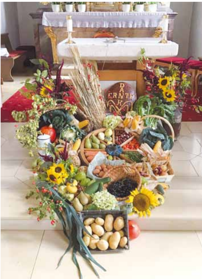
Einen reich geschmückten Erntedankaltar gestaltete heuer wieder der Obst- und Gartenbauverein Kinding.

Am 03.10.2021 wurde in den Kindinger Kirchen das Erntedankfest gefeiert. Die jeweiligen Obst- und Gartenbauvereine schmückten die Altäre.