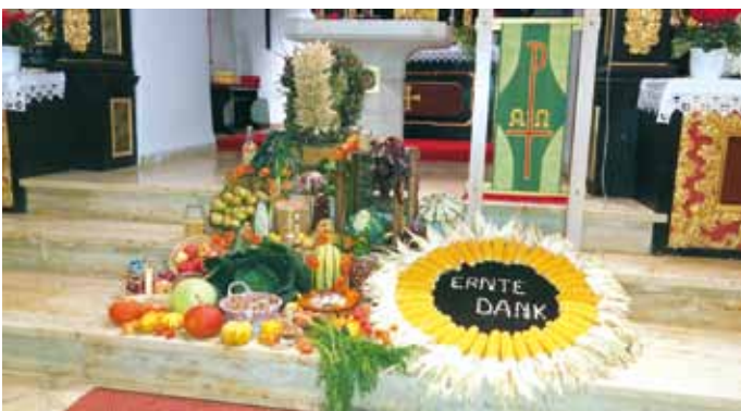
Auch in diesem Jahr wurde von der Vorstandschaft des Obst- und Gartenbauvereins Enkering der Erntedankaltar in der Enkeringer Kirche aufgebaut.