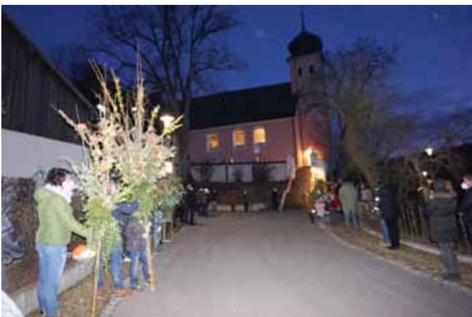
Die Gottesdienstbesucher bildeten ein Spalier zum neu gestalteten Ausgang zur Kirche in Erlingshofen.

Bereits am Vorabend des Palmsonntags feierte die Pfarrei Altdorf an der Grotte der Familie Lindner in Erlingshofen den Einzug Jesu in Jerusalem unter Corona-Bedingungen. Der neu gestaltete Ausgang zur Kirche ließ das Gotteshaus in einem ganz besonderen Licht erscheinen. Trotz alledem ließen es sich die Kinder nicht nehmen, ihre großen Palmbüsche mit in den Gottesdienst zu bringen. Traditionell werden dazu 3 Haselnussruten mit gespaltenen Weidezweigen gebunden. Der Buschen selber wird aus Eichenlaub, Immergrün, Wacholder, Tannenzweige, Buchs- und Sedelbaum, Palmkätzchen, Haselnussblüten