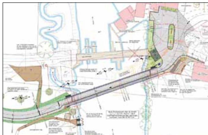
Lageplan der neuen Kratzmühlbrücke mit Zufahrt (Bild: Ing.-Büro Klos)