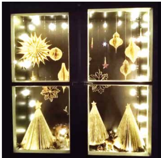
Weihnachtlich geschmückte Fenster leuchten in Unteremmdorf und können bei einem Spaziergang entdeckt werden.

(Text und Bild: Sandra Biedermann für FFW und OGV Unteremmdorf)