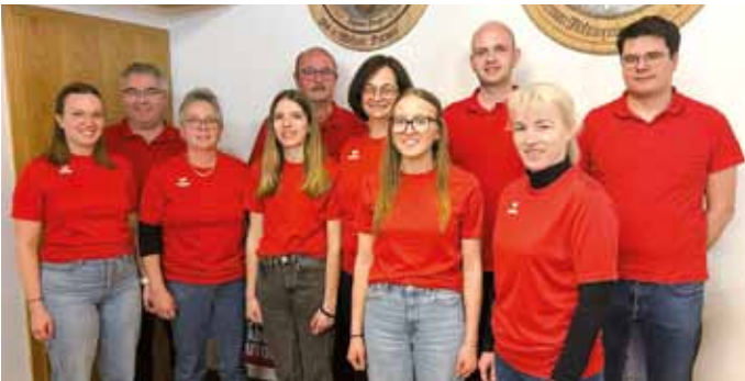
Vorstandschafft Wehrschützen Kinding