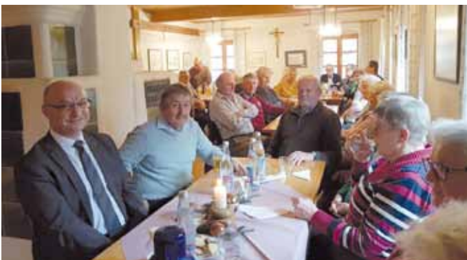
Seniorenweihnacht in Erlingshofen

Traditionell seit Jahrzehnten finden um die Weihnachtszeit die Seniorennachmittage in adventlicher Atmosphäre statt. Sie werden organisiert in Enkering (es wurde bereits in der Dezember-Ausgabe 2019 berichtet) und in Kinding von der Pfarrgemeinde, in Kirchanhausen und Haunstetten von der Landjugend und in Erlingshofen vom Heimatverein. Diese geselligen Nachmittage erfreuen sich großer Beliebtheit und werden sehr gut besucht. In dieser Ausgabe sollen daher einmal die Akteure und Organisatoren in den Mittelpunkt gestellt werden. Ihnen gilt der ganz besondere Dank für die herzerfrischenden, weihnachtlichen Feiern.