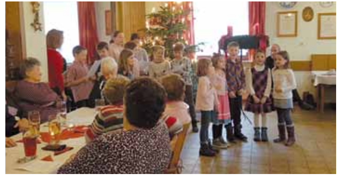
Zur Seniorenweihnacht in Haunstetten sangen die Kinder