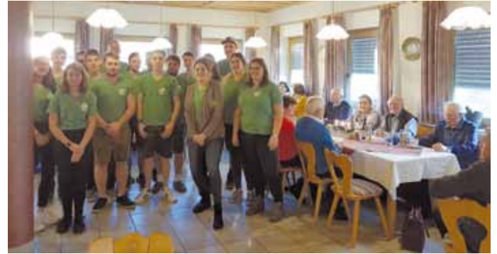
Seniorenweihnacht mit der Landjugend Pfraundorf