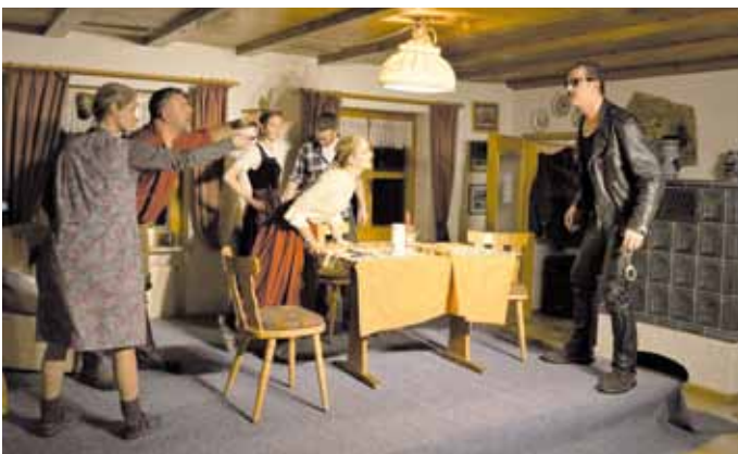
Theaterspieler der Wehrschützen Kinding im Einakter "D'Würscht san weg"

Dem Theaterstück schloss sich eine Versteigerung an, bei der die Versteigerer Robert Sammiller und Georg Brandstetter wieder viele nützliche Sachen unter die Besucher brachten.