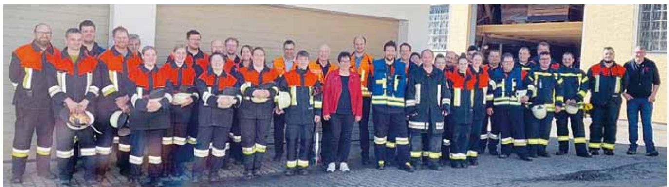
Gemeinschaftsübung: Starke Feuerwehren in Kinding: Für alle 6 Feuerwehren in Kinding hat eine Inspektion mit anschließender gemeinsamer Übung stattgefunden