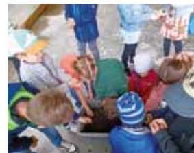
Foto rechts: Titting, Schauscheren

Foto links: Mindelstetten, Energie-Frühshoppen