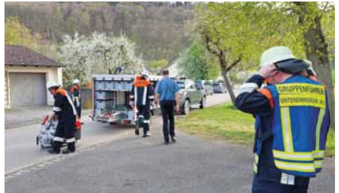
FFW Unteremmdorf, FFW Badanhausen und FFW Kinding bei der gemeinsamen Übung