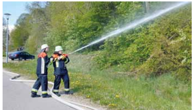
Enkeringer Frauen-Trupp in Aktion bei der Übung in Erlingshofen