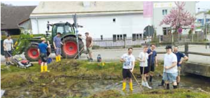
Teilnehmer an der Aktion beim Säubern der Landschaft.