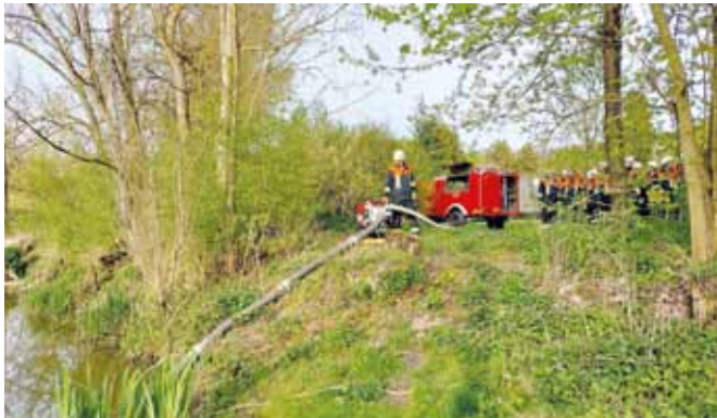
FFW Badanhausen in Aktion: Mit der Tragkraftspritze wird für den Löscheinsatz Wasser aus der Altmühl gepumpt. (Hoffentlich) letzter Auftritt mit dem alten Tragkraftspritzenanhänger (TSA)