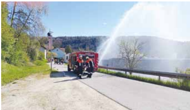
In Erlingshofen üben die Feuerwehren Enkering, Erlingshofen und Haunstetten