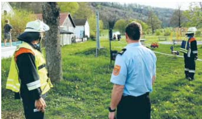
Übung in Unteremmdorf