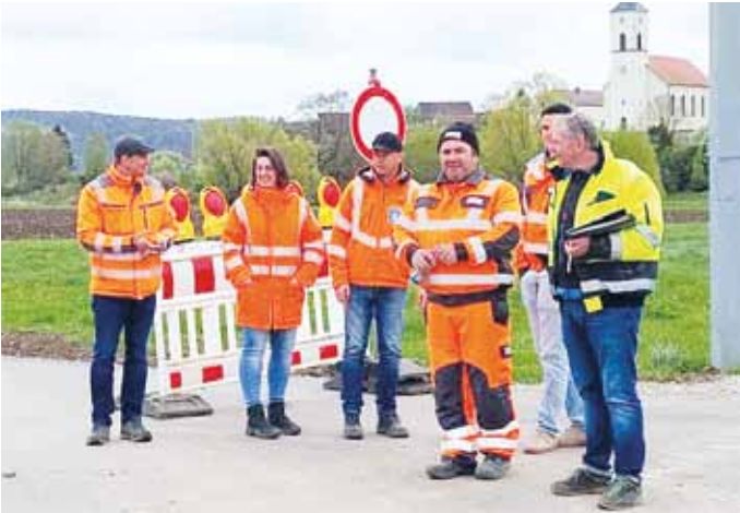
Im April konnte die Abnahme des Radweges zwischen der Kratzmühle und Beilngries – hier bei Kirchanhausen – stattfinden.