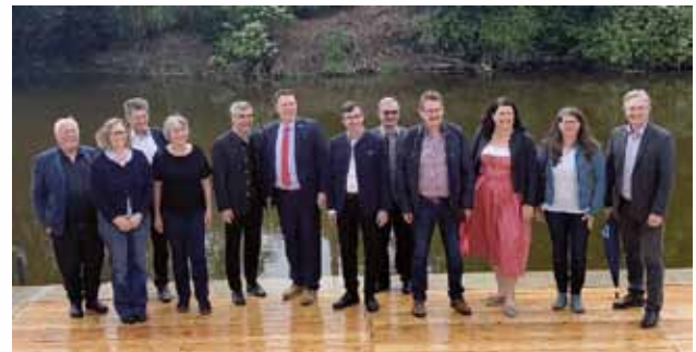
Foto rechts: Kinding, Unternehmen stellen sich vor

In Kiptenberg kamen zahlreiche Ehrengäste zur Einweihung des LEADER-geförderten Bootsrastplatzes an der „Bullenwiese“.