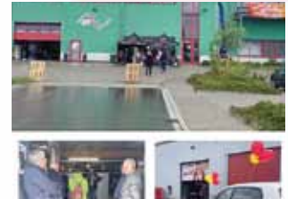
Foto links: Greding, Bauernhof Erlebnisführung

Foto rechts: Kinding, Unternehmen stellen sich vor