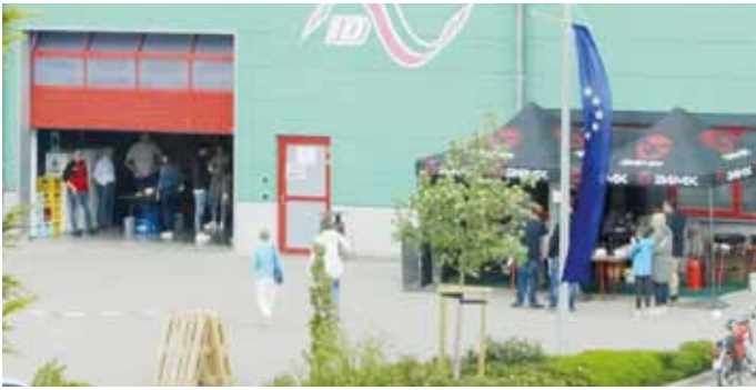
Bild 2: Ein herzliches Dankeschön geht auch an die Vereine, die an dem Nachmittag für das leibliche Wohl sorgten und die Besucher mit frischer Energie versorgten.