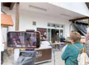
Foto rechts: Beilngries, Führung durchs Klärwerk

Foto links: Altmannstein, alles rund ums Wasser © Gabriele Hirte