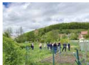
Foto links: Berching, im Zeichen von Citta Slow

Foto rechts: Breitenbrunn, Infos rund ums Biotop