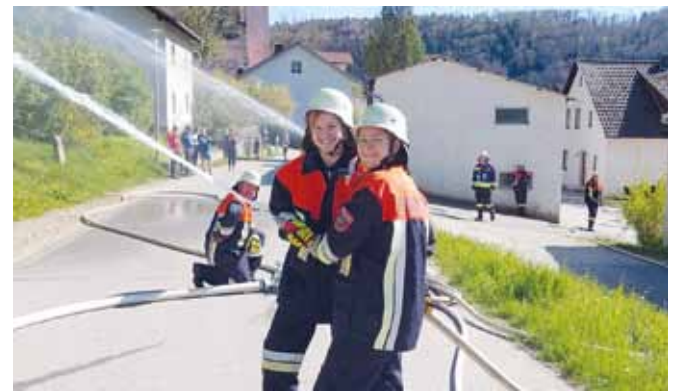
Gemeinsame Übung mit Frauenpower