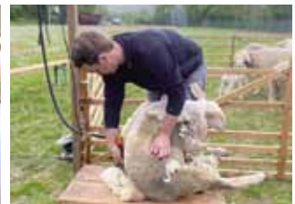
Foto links: Mindelstetten, Energie-Frühshoppen

Foto rechts: Titting, Schauscheren