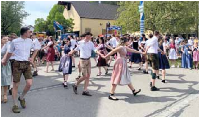
Die Burschen und Mädchen begeistern mit den dargebrachten Maitänzen unter dem neu errichteten Maibaum.