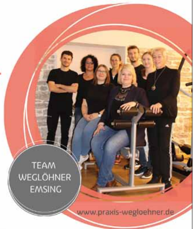
TEAM WEGLÖHNER EMSING